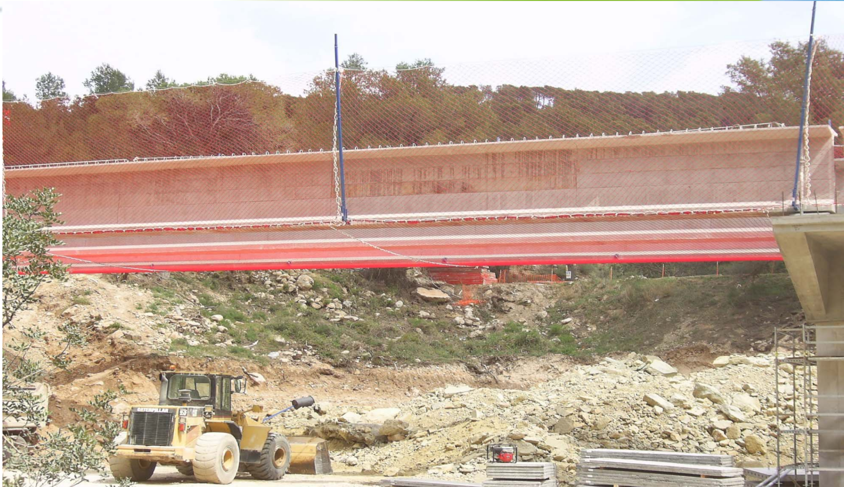
Instalación de red tipo S en obra civil